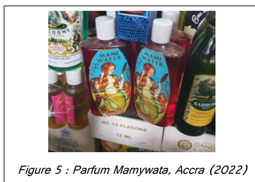
Figure 5 : Parfum Mamywata, Accra (2022)