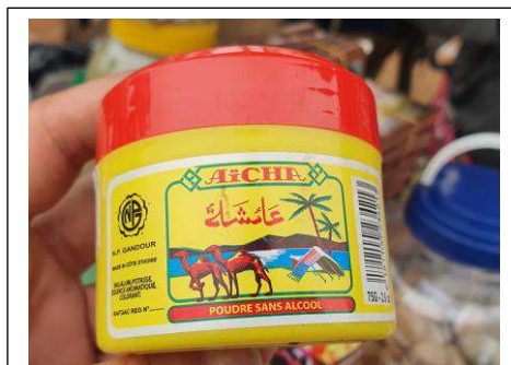
Figure 1 : Aïcha, poudre vaginale halal, Lomé (décembre 2022)