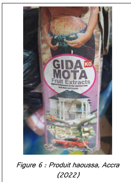
Figure 6 : Produit haoussa, Accra (2022)

Jusqu'à récemment, les populations du sud (éwé et d'autres) ne recouraient à des substances raffermissantes que pendant la période post-accouchement, et la pratique du « sexe sec » ( dry sex ) n'était pas répandue. Au contraire, des pratiques d'élargissement vaginal ont été observées dans la région des Plateaux par Simyeli (2015), qui atteste l'existence de manœuvres obstétricales traditionnelles visant à élargir le vagin des jeunes filles et à les déflorer pour faciliter et rendre moins traumatiques les premiers rapports sexuels. De façon générale, dans les sociétés rurales non christianisées ou islamisées, la fécondité était privilégiée sur la virginité prémaritale. Les rites d'initiation (dont par exemple le Akpema ) sanctionnaient la sexualité prépubère et pré-érotique et non pas forcément la sexualité prémaritale.