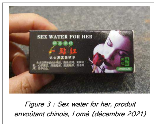
Figure 3 : Sex water for her , produit envoûtant chinois, Lomé (décembre 2021)

Les produits sexuels chinois en vente au Togo et au Ghana sont principalement des lubrifiants industriels féminins et des stimulants masculins à base de Sildenafil (liquide, spray, gel, capsules). Ces derniers, quand ils sont achetés en tant que « secrets », sont administrés par les clientes aux partenaires à leur insu pour « booster » leur érection et libido. Récemment, des produits vaginaux chinois dits « de domination » sont apparus dans les marchés et sont vendus avec les « secrets », comme cela a été rapporté également par Bila (2015). Un produit appelé Silver Fox , déjà recensé au Burkina Faso, a été repéré au Ghana et Togo : il s'agirait d'un aphrodisiaque chinois qui serait capable d'« envoûter » le partenaire masculin. Un autre, appelé Sex water for her , aurait pour effet de provoquer une vague irrésistible de désir et d'amour chez l'homme et il serait administré par voie orale (« This product is colorless and tasteless, and can be quickly dissolved in wine and beverage », figure 3). À partir des données recueillies, ces produits « envoûtants », plus adaptés à la clientèle féminine locale, se sont récemment rajoutés aux stimulants sexuels « classiques ».