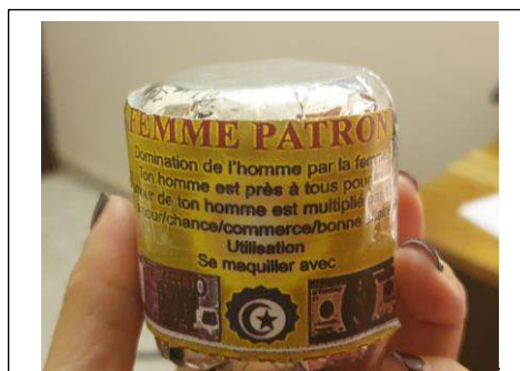
Figure 2 : Femme patron, produit vaginal de domination, Lomé (décembre 2021)

Le produit le plus largement utilisé pour rétrécir et assécher le canal vaginal, omniprésent dans tous les sites de vente, est la pierre d'Alun, au Togo appelée alam , sous forme solide et en poudre. Elle est appliquée de plusieurs manières : dissoute dans l'eau pour la toilette intime, frottée sur les petites et les grandes lèvres et à l'intérieur du canal vaginal, insérée dans le canal vaginal pendant des jours, « cuite » à la vapeur. Cette pierre, appelée aussi « de virginité », est distribuée également dans les boutiques « africaines » à Paris par les commerçantes dites « maliennes 12 ». Souvent considérée halal , associée à la « beauté arabe » et à la « modernité » représentée à la fois par la norme virgine et par les injonctions hygiénistes des organismes de développement, cette pierre est largement utilisée au Togo comme déodorant vaginal et « remède » de virginité.