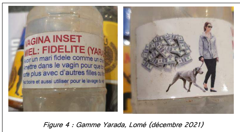
Figure 4 : Gamme Yarada, Lomé (décembre 2021)