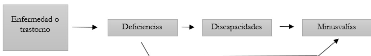
Figura 1: Clasificación Internacional de Deficiencias, Discapacidades y Minusvalías (OMS, 1980)

La deficiencia es toda pérdida o anomalía de una estructura o función psicológica, fisiológica o anatómica.