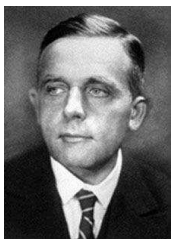
Figure 1. Otto Warburg

Les tumeurs présentent une hétérogénéité génétique et phénotypique qui implique des signatures métaboliques différentes des cellules au sein d'une même tumeur. Par exemple, 30 % des cancers ne sont pas détectés par la technique 18 F-DG-PET, soit parce que leur utilisation du glucose se situe sous le seuil de détection, soit parce que ces tumeurs utilisent des voies métaboliques non glucidiques pour générer leur énergie. La réponse métabolique d'une cellule tumorale dépend à la fois de mutations d'oncogènes et/ou de suppresseurs de tumeurs ainsi que des conditions de son environnement. La caractérisation des différentes voies métaboliques mises en jeu lors du développement et de la progression tumorale est donc nécessaire à l'élaboration de thérapies efficaces.